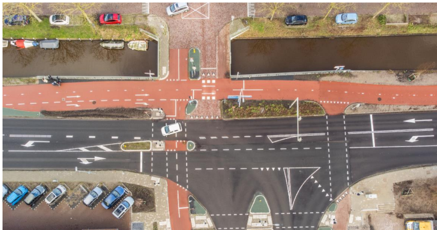
Foto: Justin Egberts, ter hoogte van Boerendijk-Prinsenlaan-Hoge Rijndijk

verkeersplannen in. Belangrijke te realiseren punten zijn voor mij: het autoluw maken van de centrumring en het aanleggen van een Oostelijke randweg. Heeft u tips of vragen rondom vervoer? Geef het door!